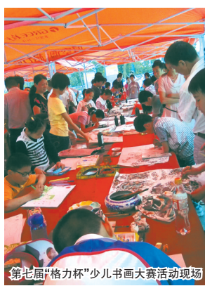
第七届“格力杯”少儿书画大赛活动现场

作为一项纯公益的活动,格力每年为此都将花费许多人力物力。对此,“格力杯”少儿书画大赛合肥赛区相关负责人说,少儿书画大赛是格力关爱孩子、回报社