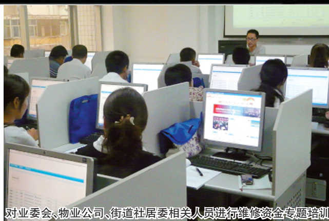
对业委会、物业公司、街道社居委相关人员进行维修资金专题培训