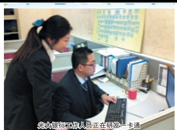
光大银行工作人员正在研发一卡通