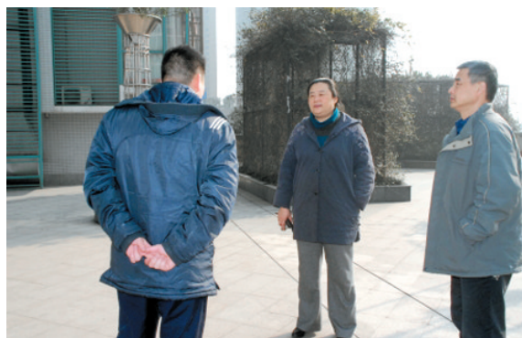
合肥市物管中心主任深入基层,在物业小区现场办公,为业主解燃眉之急