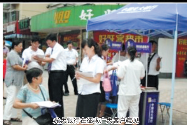
光大银行在征求广大客户意见