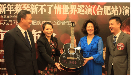
图为新闻发布会仪式启动现场

主办方正在紧锣密鼓的筹备当中，蔡琴本人也正在为演唱会做各种准备，而本次跨年演唱会合肥站由中国建设银行安徽省分行总冠名。