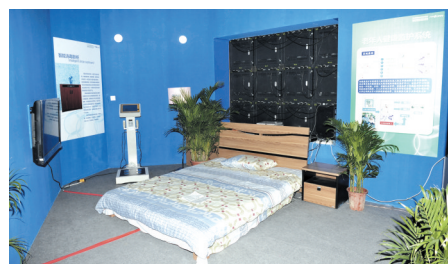
老年人健康监护系统

●第四届家博会于2010年11月27日~29日在安徽国际会展中心举行。共签署投资、贸易和供需对接项目112个,总额311亿元。 记者 刘甜甜