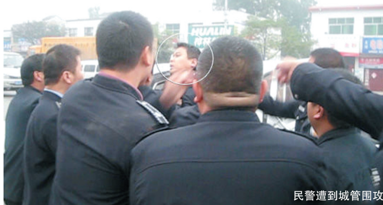
民警遭到城管围攻

车上被城管卡着脖子,几乎要窒息,“感觉自己快要死了”,更让他难以理解的是,对他下狠手的不是社会闲杂人员,而是执法人员,而对方反说他动手打人,要不是有现场视频,他真是有