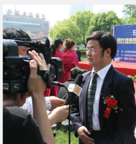
各大媒体纷纷报道活动情况