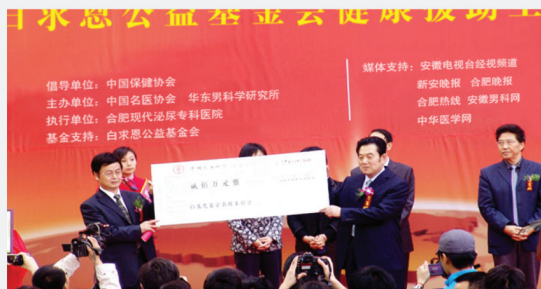
白求恩公益基金会为本次活动提供援助基金

泰斗国庆期间来院坐诊，并为患者和三甲专家之间开通便捷通道，开展“一对一私密问诊”等服务。本次活动还得到了白求恩公益基金会的鼎力支持，用于援助本次惠民活动的开展。