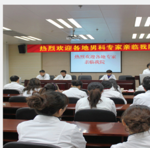
各地三甲医院名医齐聚现代泌尿专科医院