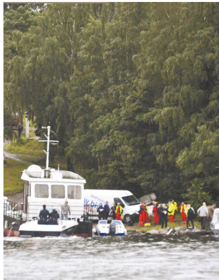
枪击事件受害者躺在礁石上