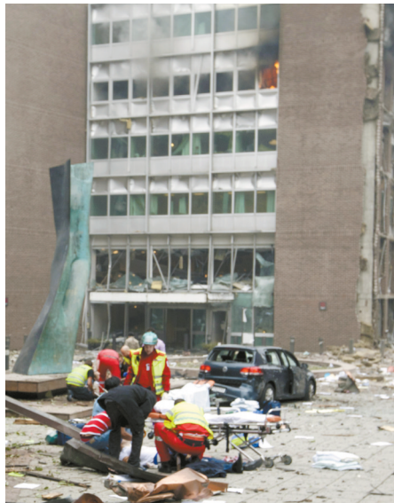
挪威奥斯陆发生爆炸