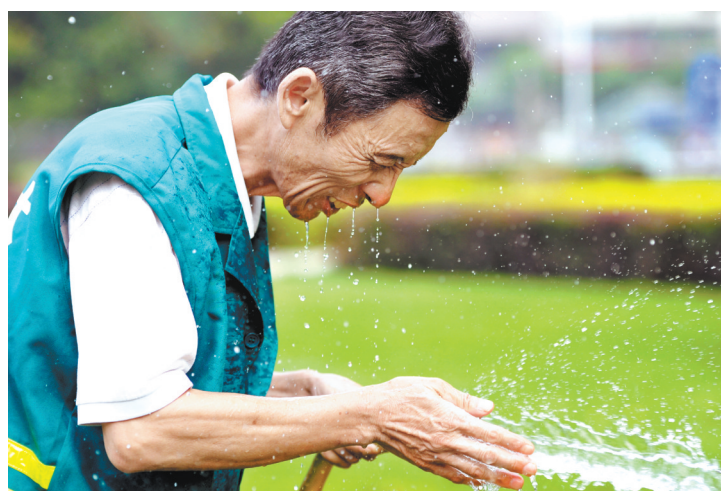
昨日,合肥一园林员工一边浇水,一边冲脸

针对一些建筑工地、交通运输、市政工程、环卫保洁等这些长期在户外高温作业的人群来说,高温补贴如果被拖欠或是滞后,员工又该如何维权?据了解,员工可以通过向辖区劳动保障监察大队、安监部门、行业直属主管部门反映,以保证自己的合法权益。