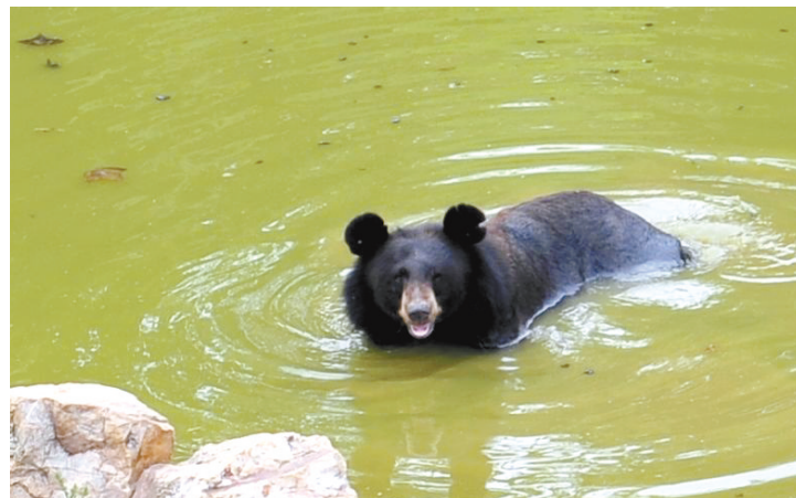
昨日,合肥野生动物园里的黑熊下水避暑