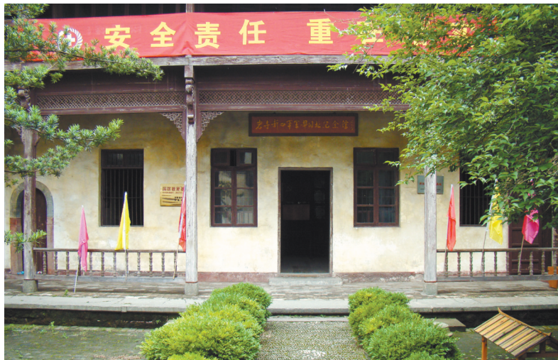
岩寺新四军军部旧址纪念馆

昨日上午，记者伫立在空旷的点将台前，当年新四军将士们激情高呼抗战到底的铮铮誓言，恍惚间又在耳边回荡。