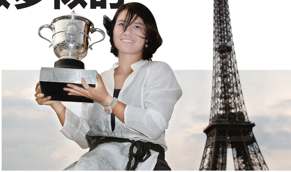
李娜夺冠后在巴黎留影