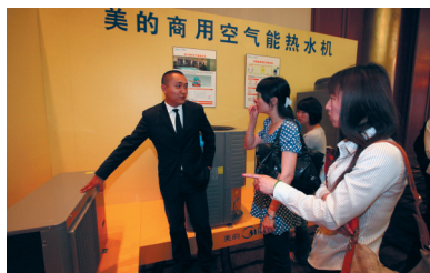
专家媒体参观美的空气能热水机新品

节能环保是二十一世纪经济发展面临的重大问题,随着经济的不断发展和人们生活水平的不断提高以及人们环保意识的增强,越来越多的人在追求生活质量的同时也追求