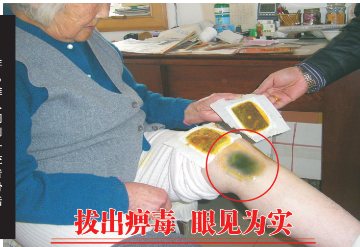
拔出痲毒 眼见为实

一贴下去,风寒湿邪排出体表,皮肤表面出现青紫,24小时疼痛消失。无论颈椎病、腰椎病、关节炎、滑膜炎、还是骨质增生、老寒腿、肩周炎、腰肌劳损,使用魏氏秘制膏药通络拔毒,深藏体内一二十年的风寒湿邪都能统统清除体外,不到100天,患者能跑能跳,就像从没得过骨病一样!患者可拨打电话0551-2135567咨询!