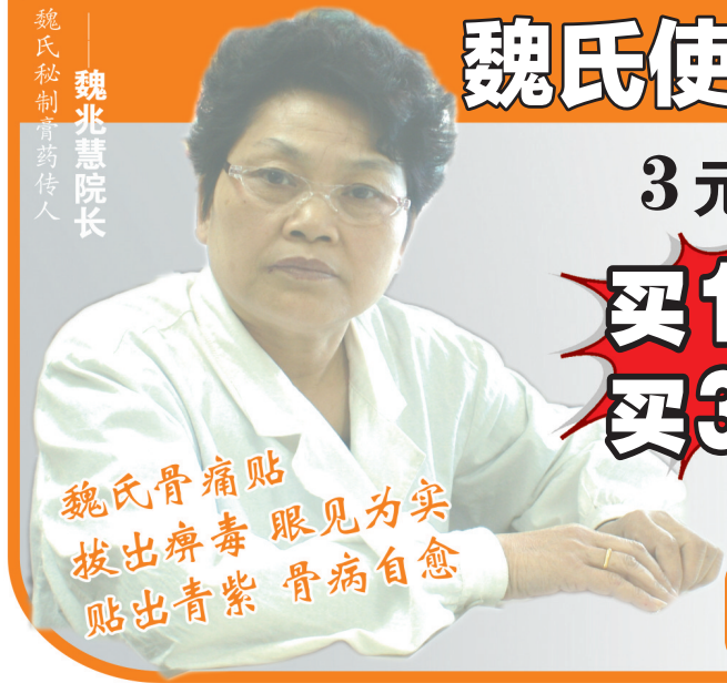
魏氏秘制膏药传人