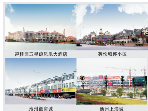
碧桂园五星级凤凰大酒店

安全生产紧抓不懈。园区以深入开展“安全生产年”、“安全生产宣传月”等活动为主线，以有效防范、坚决杜绝死亡事故，减少一般性事故发生为目标，以在建项目的建筑安全和专业市场用电、防火安全和危险品管理等为重点，进一步落实了安全生产责任制，严格安全监管，强化宣传教育，着力开展各类隐患排查和专项整治。努力构建保障科学发展、和谐发展的长效机制。