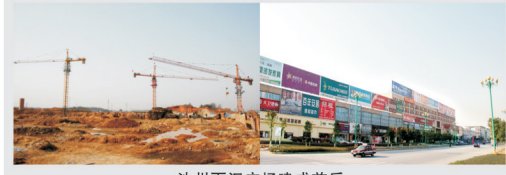
池州百汇广场建成前后