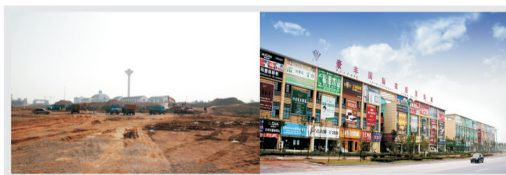
池州国际家居装饰城建成前后

项目落户工作紧抓不懈。为使在谈项目能够切实落户园区，池州站前区确定专人跟踪督办，了解企业动态，做