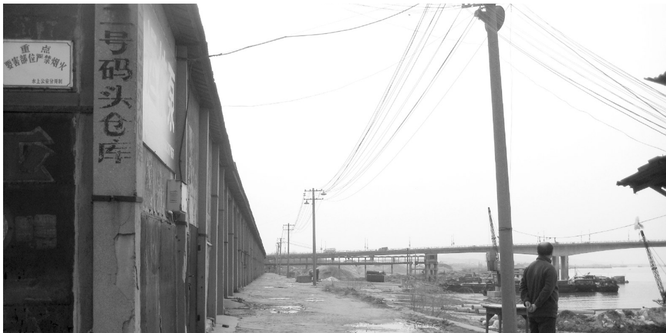
昔日繁华的“千里淮河第一港”蚌埠港，如今看上去空旷萧条

蚌埠百年两座桥，码头文化岁月造。1911年，淮河大铁桥建材，津浦铁路南段经过珠城蚌埠并通车。随着津浦铁路的全线贯通，蚌埠逐渐发展成为皖北商贸重镇、淮河流域的中心城市。100年后的2011年，京沪高速铁路将全线通车并在蚌埠设站，这座城市将从此跨入高铁时代。