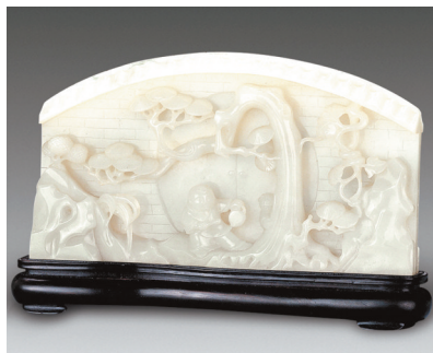
白玉童子击鼓砚屏

梨木、紫檀木、老红木、楠木、榆木等,可谓极尽奢华。 有一种大理石砚屏,是插屏中最小的一种,主要置于案桌之上,是摆在文人雅士们书画所用砚台的后面,既可挡尘,又可观赏的一种设品。笔者藏有一件砚屏,是清代红木拉花砚屏,此砚屏小巧雅丽,红木座四边都采用古代的拉花镂空技艺,犹如园林曲廊间的花格漏窗一般玲珑雅丽,砚屏中间镶嵌的大理石屏面虽其尺寸比手掌大不了多少,但咫尺间有群峰逶迤,四周云雾苍茫,那微白的石屏间黛绿色的山峦图纹犹如一幅烟雨空濛的山景,更奇的是群峰间还有“界破青山色”的一