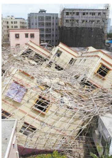
突然坍塌的7层在建楼房