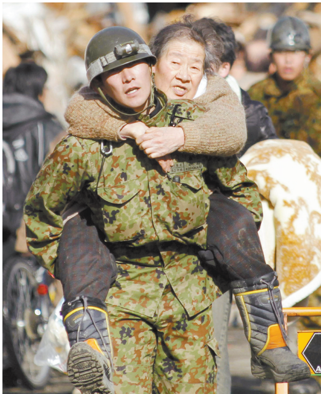
自卫队队员背着当地居民撤离