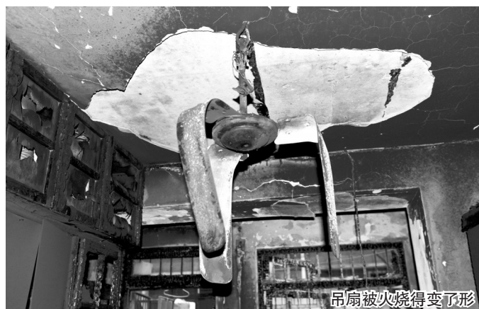
吊扇被火烧得变了形