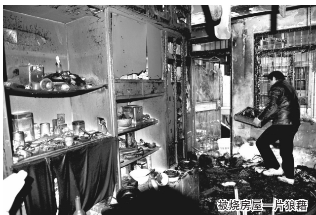
被烧房屋一片狼藉

昨日下午4时许,省城戴安桥巷老交通局大院11栋某室突发大火,起火时,家中只有一名65岁的老人正在睡觉。闻到糊味,机智的老人醒来后立即逃离火海,而他家却被烧成了废墟。据初步了解,失火原因疑是线路老化。 记者 张崴/文