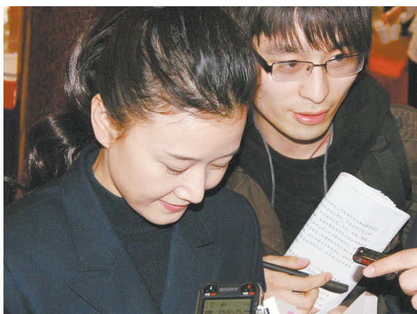
宋祖英为本报特派记者签名