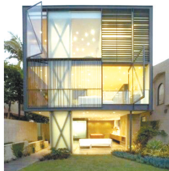
2 Hover House 出自于伊朗建筑师格伦的作品，位于加州洛杉矶威尼斯运河。挑战的项目是为了户外空间最大化，创造一个似乎倒着盘悬在地面上的。