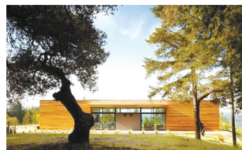
3 自然之屋 坐落在山顶，这套房子提供的景色是美不胜收的俄罗斯河谷。建造这个房屋，建筑师道林考虑使用了最可持续材料和节能系统。