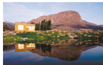
4 Ecomo 美丽而且精致的房屋来自皮埃特罗拉索，建筑旁有着催眠一般的风光。基于绿色、可持续发展的特点。