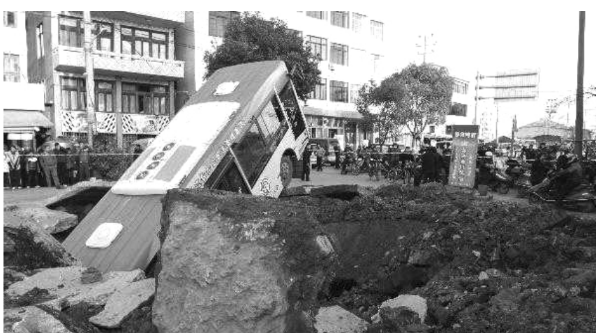
公交车掉入路面大坑中

据新华社电 浙江温州瑞安一道路1月16日发生爆炸，炸出10米大坑，一辆途经的公交车被掀4米多高，驾驶员被安全救出。