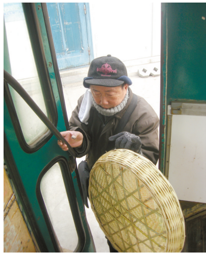
前门只能打开一半,老人侧身上车