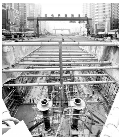
轻轨南一环车站北端施工现场