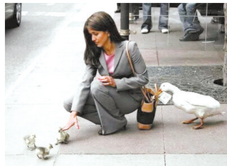
明抢易躲, 暗窃难防