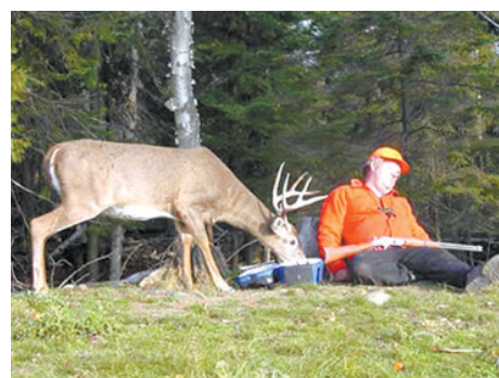
好好睡啊, 等我吃完再醒