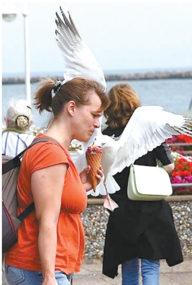
趁人不注意, 尝尝冰激凌