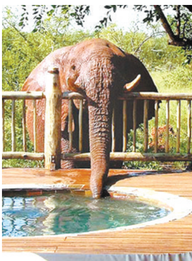
游泳池没人, 偷点水喝

《拍吧》很长时间没跟大家见面了, 本期特地选了一组关于“偷窃”的趣味图片。快春节了, 提醒读者欣赏之余, 提防自己的荷包。 王震/文