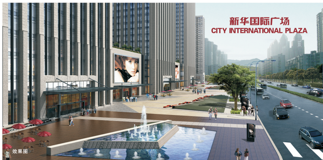
新华国际广场 CITY INTERNATIONAL PLAZA

新华地产再度携手世界顶级建筑规划团队及物业管理团队，巡礼全球，通过不断的学习和考察全球各地著名城市商务区，将世界前沿的建筑理念和国际标准带到合肥。为全球高端商务人士提供商务交流、时尚购物于一体的一站式全程商务办公解决方案。