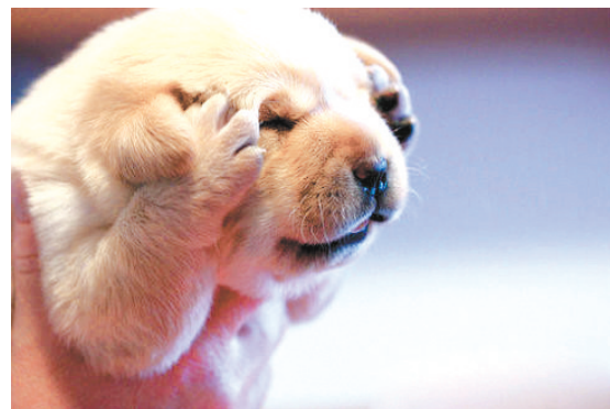
烦躁 动物与人相似,烦躁起来会抓头,并不想看到这个世界。