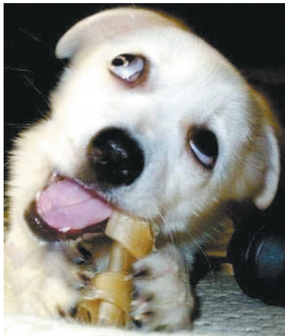
执着 这种永不言弃的劲头,证明它确实饿了。