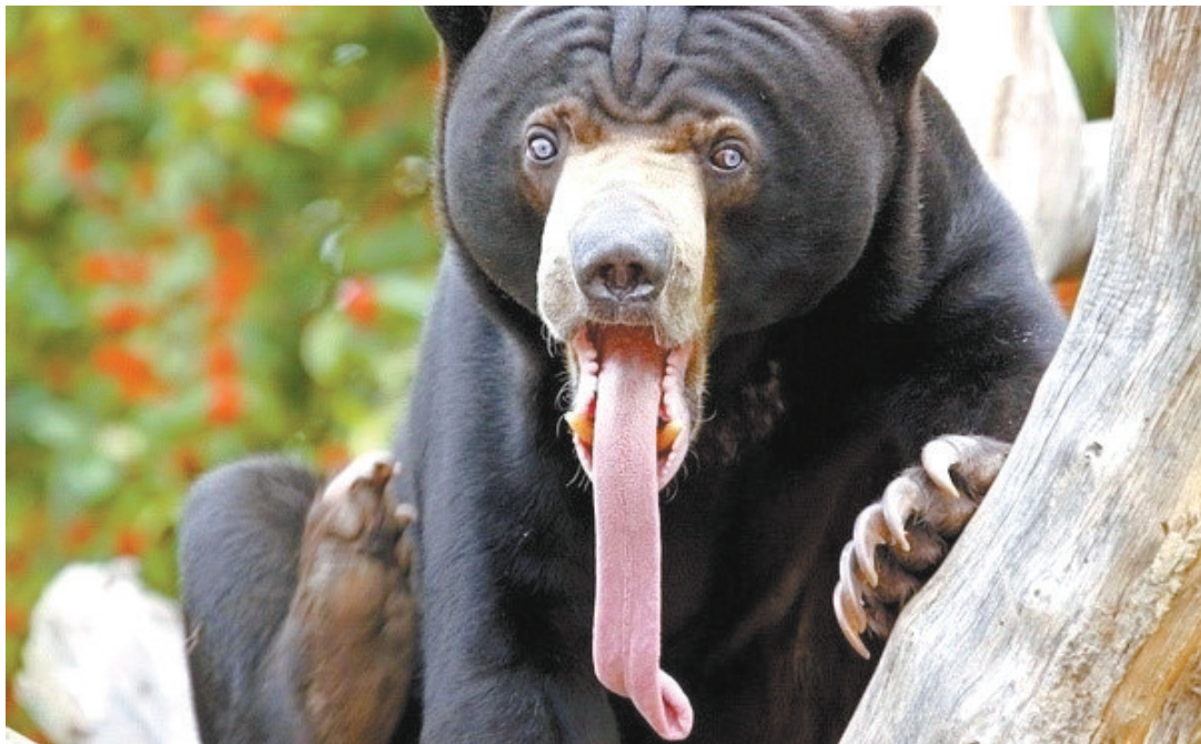
鬼脸 这张脸拿去拍电影,不用化妆直接可以演黑无常。