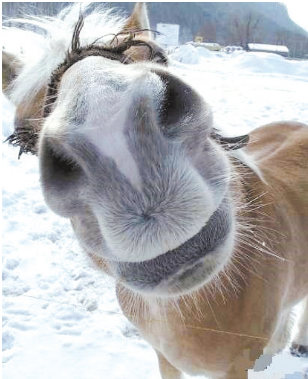
得意 看得瑟的小模样,真把自己当大牌明星了。