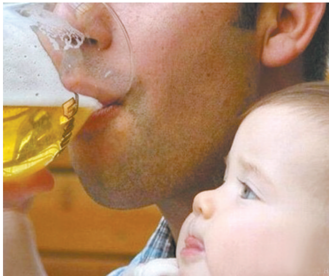
我们羡慕的东西，常常是现阶段我们不该拥有和尝试的。