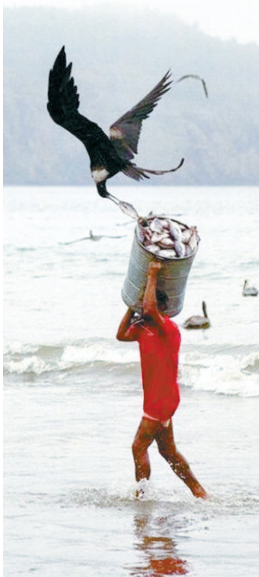
与其嫉妒别人的财富，不如想想别人致富路上的辛劳。