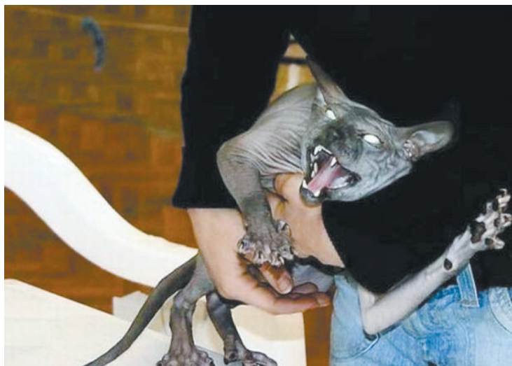
困兽犹斗，失去自由是最大的恨。