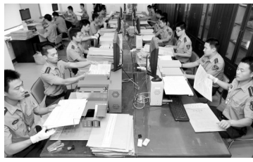
军校研究生扫描试卷