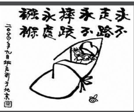
漫画《永不走路,永不摔跤》